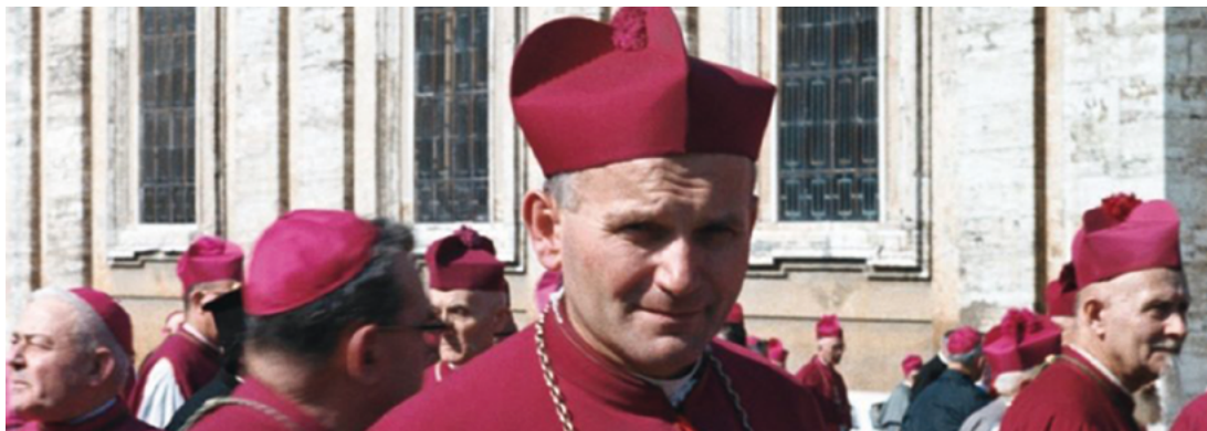
Kard. Karol Wojtyła podczas Soboru Watykańskiego II